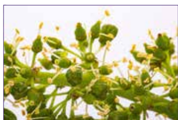
A Chute des capuchons