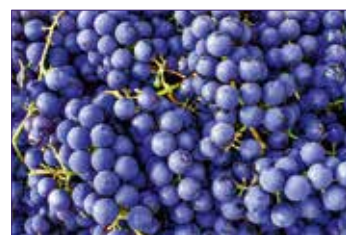
D 21 jours avant vendange