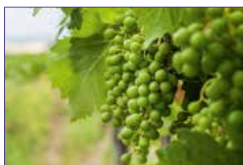
B Fermeture de la grappe