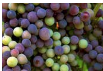
C Début de véraison