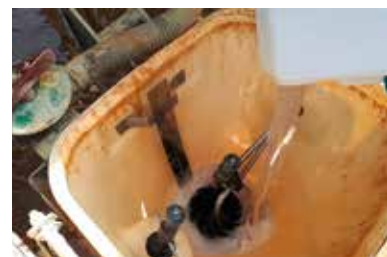
TABLEAU DES USAGES